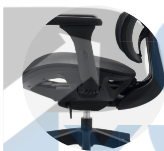
Mecanismo syncro 4 bloqueos.