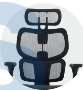
Espaldar en malla Nylon.